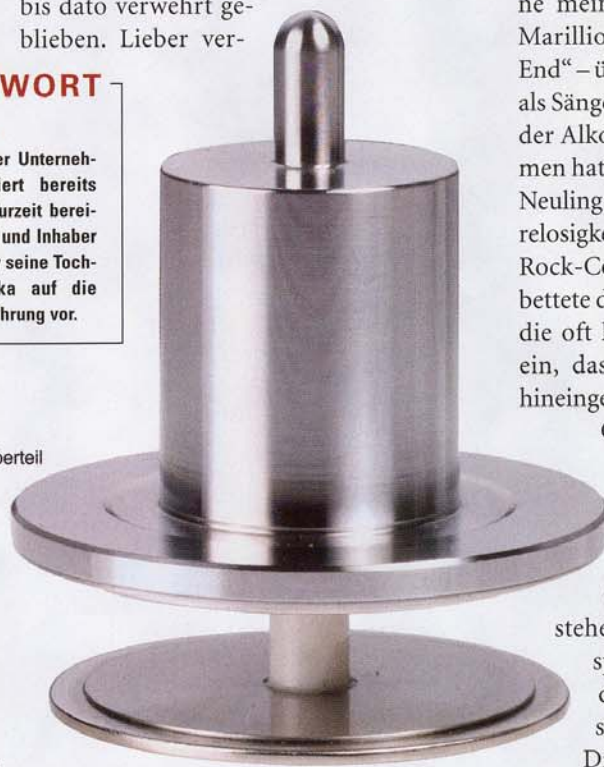
Der Plattenteller schwebt fast völlig reibungsfrei auf Clearaudios neuem Magnetlager und ist so wirksam entkoppelt. Der Unterschied zu anderen magnetischen Lagern besteht vor allem in der Lagerachse aus Keramik