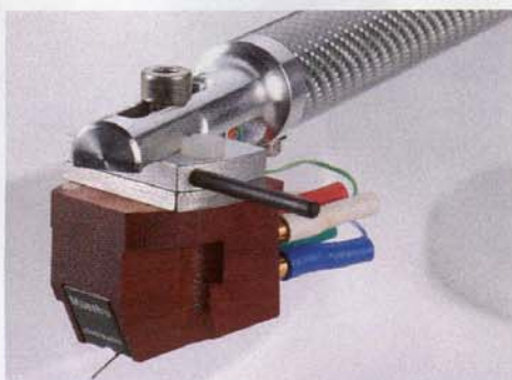
Genial simpel ist die Einstellung des Überhangs und der Kröpfung. Beim Performance wird das Maestro Wood von Clearaudio gleich vormontiert

Natürlich zeigt sich der zeitlos-modische Erlanger auch bei allen anderen Stilrichtungen moderner und klassischer Musik mit einer eleganten Souveränität und einem bruchlosen Spielfluss, den man gern stundenlang genießen möchte. Bei allem Vergnügen, den es bereitet, lange nicht gehörte Schätzchen aus dem Plattenregal zu kramen und in neuer Frische anzuhören, fällt die extreme Ruhe und Rauscharmut des Klangbildes auf. Selbst Aufnahmen, die jahrelang nicht gespielt wurden und auch keiner reinigenden Behandlung unterzogen wurden, rumpeln und knacken erstaunlich wenig. Laut Peter Suchy ein Verdienst des besonderen Nadelschliffes. Die Unempfindlichkeit gegenüber Trittschall oder anderen unerwünschten Erschütterungen rechnen wir sowohl dem Magnetlager des Tellers als auch den üppig dimensionierten Standfüßen zu.