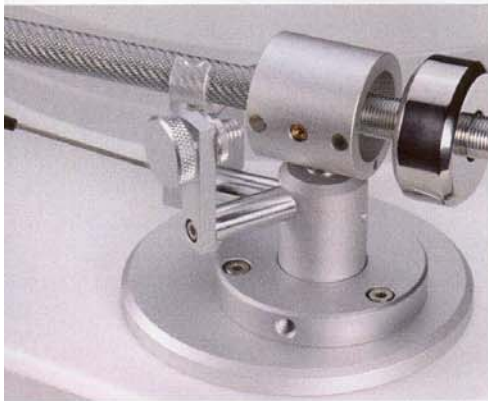
Die beiden runden Punkte links und rechts der Stellschraube am Armende sind die Magnete der Anti-Skating-Vorrichtung, die zuverlässig arbeitet

einem straffen, trockenen und grundehrlichen Bassfundament, das nie aufgedunsen wird. Eine Darbietung, die mich garantiert nie wieder zur CD-Version dieser Platte greifen lässt. Gegenüber einer solch überzeugenden Musikalität nimmt sich die Silberscheibe wie ein Abziehbild aus. Meine Hochachtung, liebes Clearaudio-Team, habt Ihr Euch an dieser Stelle verdient!