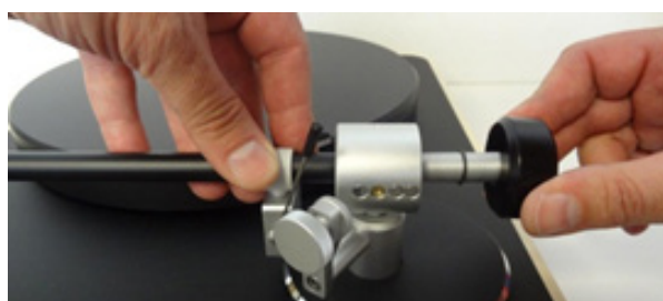
Pic. 2: Installing the counter weight