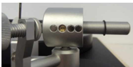
Pic. 1: Delivery condition as supplied to customer (without installed counter weight)

1. To install the counter weight, please push it with pressure, but also carefully, on the shaft up to the black marking ring (see picture 1, 2 and 3). Please hold tight the tonearm tube when you push the counter weight onto the shaft!