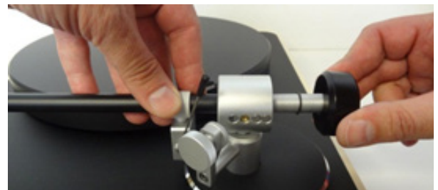
Abb. 2: Montieren des Gegengewichts