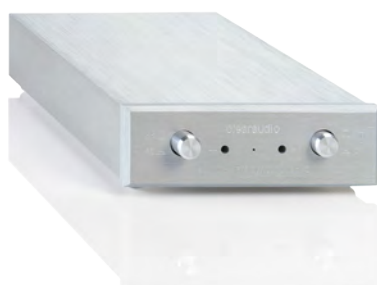
Abb. 1: Lieferumfang