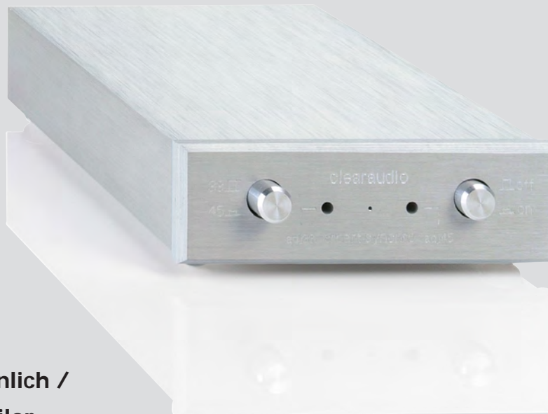
Abb. ähnlich / Pic. similar