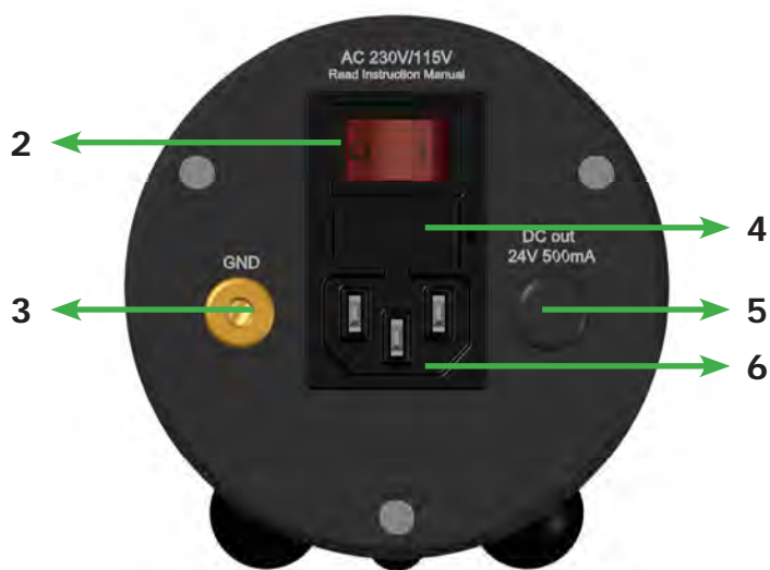
Pic. 2: Rear view