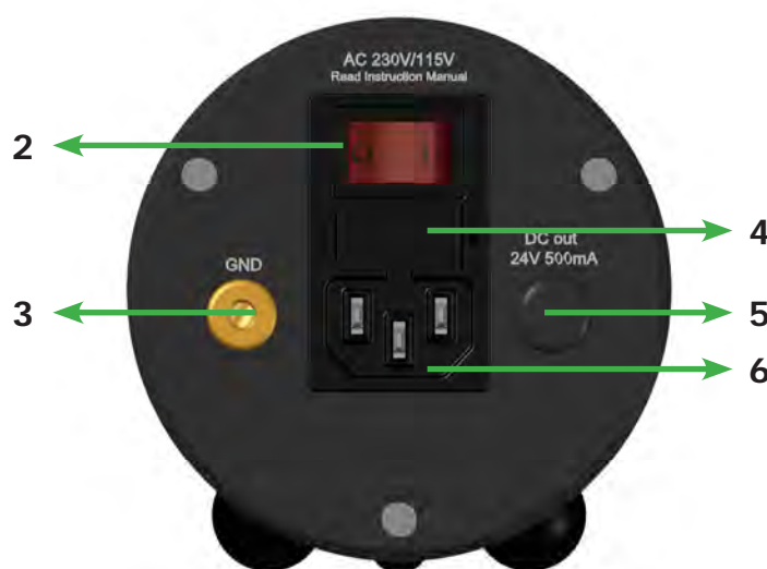
Abb. 2: Rückansicht