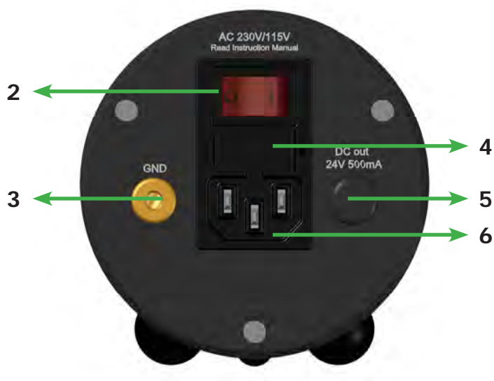
Pic. 2: Rear view