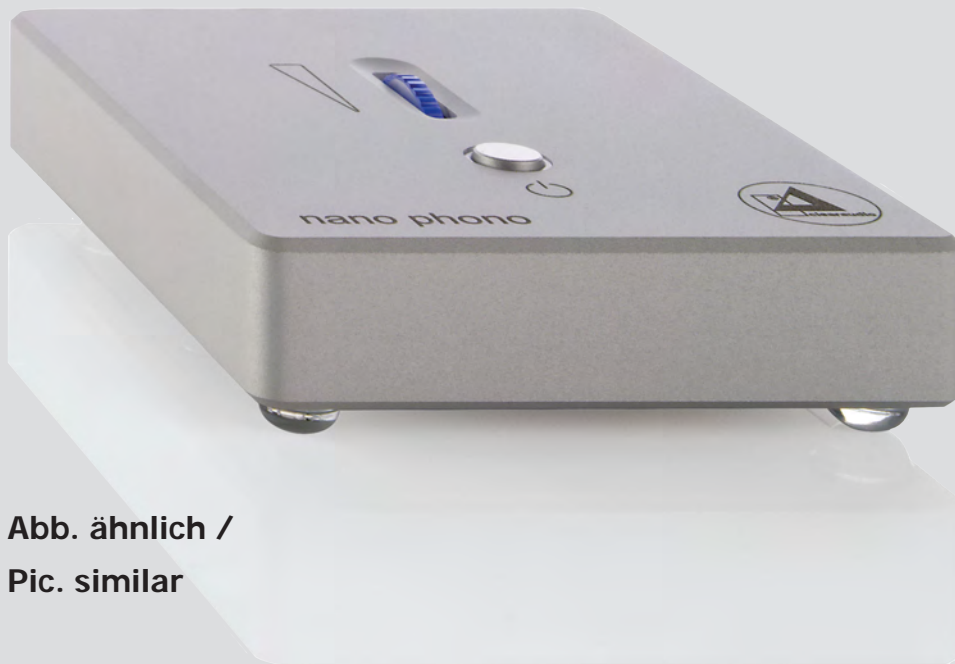
Abb. ähnlich / Pic. similar