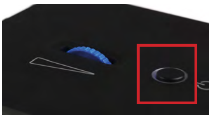
Abb. 5: Druckknopf

Falls das Gerät eine längere Zeit nicht in Benutzung ist, schalten Sie das Gerät oben am Druckknopf (siehe Bild) aus. Oder trennen Sie das Gerät komplett vom Stromnetz in dem Sie das Steckernetzteil aus der Steckdose entfernen.