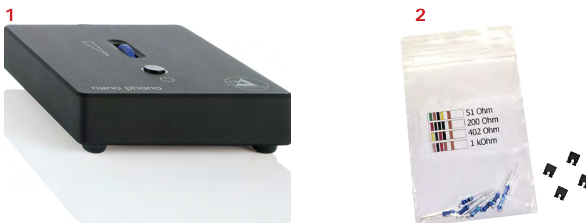
Abb. 1: Lieferumfang

Bitte kontrollieren Sie den Lieferumfang Ihrer neu erworbenen nano phono V2 Phono-Vorverstärker auf deren Vollständigkeit: