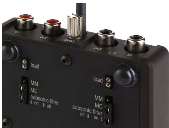
Abb. 3: Geräteunterseite