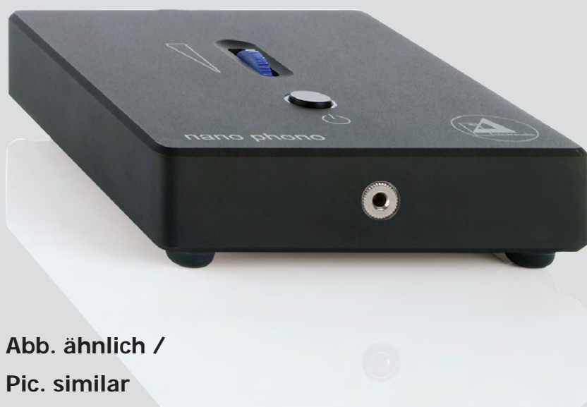
Abb. ähnlich / Pic. similar