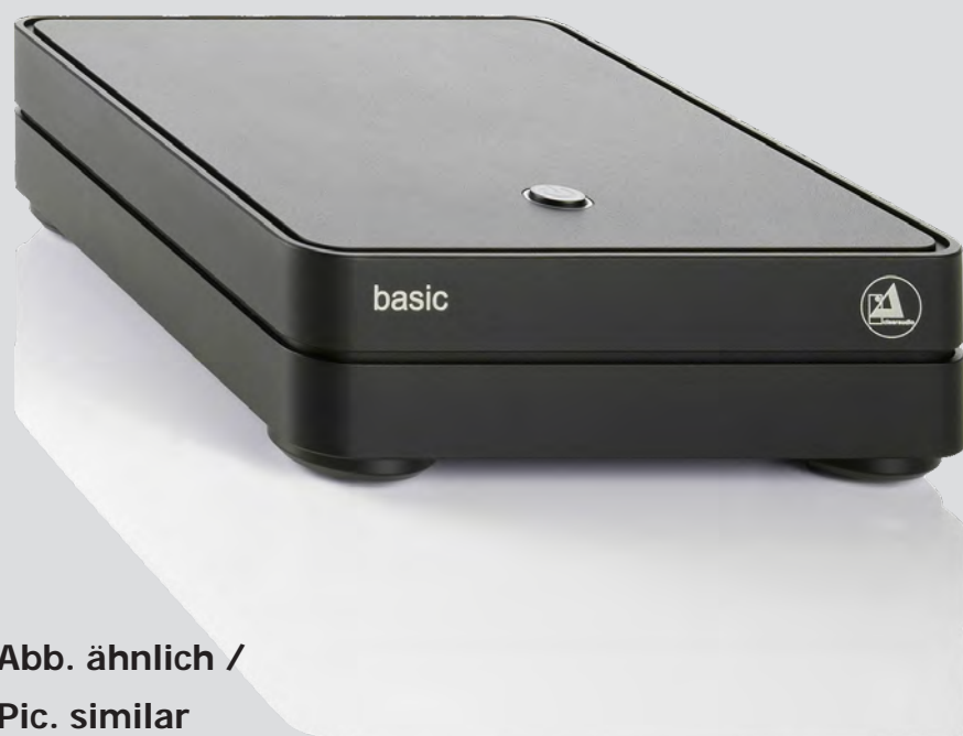
Abb. ähnlich / Pic. similar