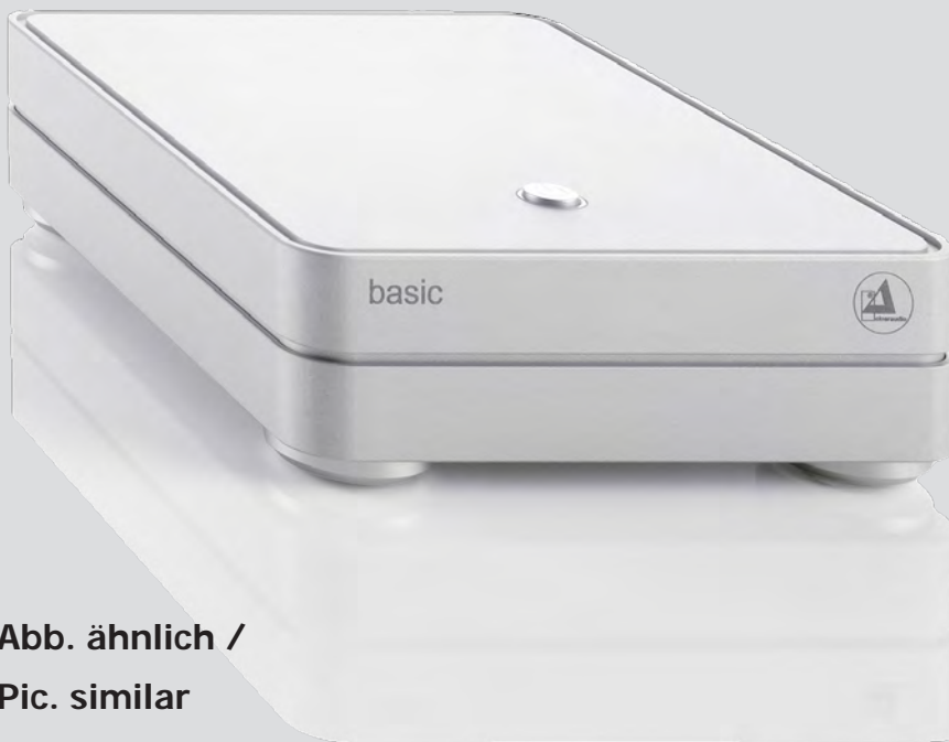
Abb. ähnlich / Pic. similar