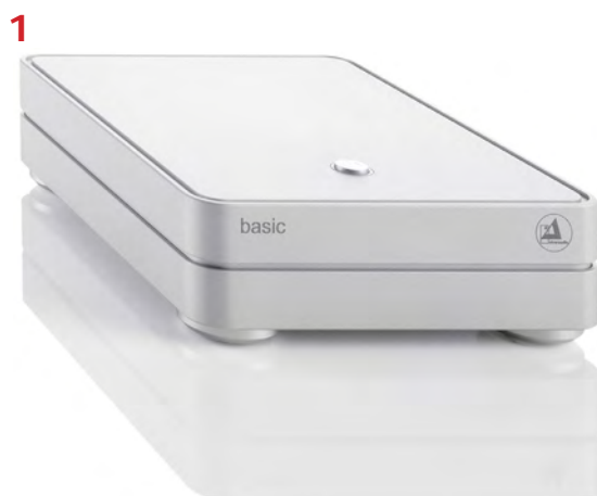
Pic. 1: Package contents

Please check the contents of you're newly purchased phono preamplifier.