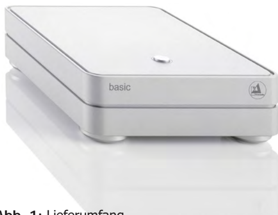
Abb. 1: Lieferumfang