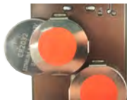
Abb. 5: Einsetzen der Batterien

Entfernen Sie die Platine, indem Sie diese an dem Griff unterhalb des Tasters aus dem Gehäuse herausheben. Die Batterien befinden sich auf der Unterseite der Platine.