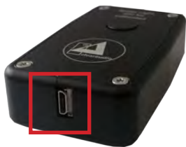
Abb. 1: Micro-USB für direkten Stromanschluss.

Das clearaudio Speed Light V2 ist durch die bereits eingesetzten Batterien oder durch Dauerstrom mittels Micro-USB (Kabel nicht im Lieferumfang enthalten) sofort einsatzbereit.