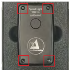
Abb. 3: Öffnen des Gehäuses

Lösen Sie mithilfe des im Lieferumfang enthaltenen Innensechsrundschlüssel die vier Schrauben auf der Oberseite des Gerätes und entfernen Sie die Abdeckung.