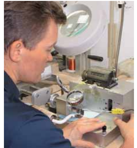
Hier wickelt man ultrafeinen, korrosionsbeständigen Golddraht auf winzige Spülchen, die anschließend nochmal selektiert werden

Es gelang etwa, die Reibung der Kugellager des Armschlittens auf seinem Präzisionsglasstab deutlich zu reduzieren. Die fingerartigen Ausbuchtungen der Montageplatte der großen MCs sollen dagegen deren Schwingungsverhalten zugleich minimieren und optimieren. Resonanzen laufen sich in den verschiedenen Radien und Wölbungen schlicht tot. Alles Kleinigkeiten, aber wer den Anspruch hat, mit die besten Tonabnehmer zu bauen, muss die Gesetze ihres Mikrokosmos befolgen.