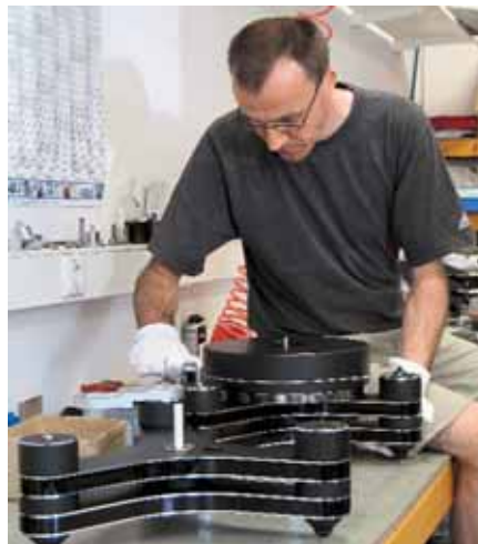
Passt alles? Beim „Innovation“ schwebt der Teller auf einem Magnetlager. Die weiße Keramikachse sorgt nur für die Seitenführung