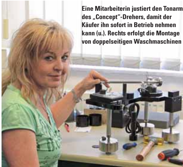
Eine Mitarbeiterin justiert den Tonarm des „Concept“-Drehers, damit der Käufer ihn sofort in Betrieb nehmen kann (u.). Rechts erfolgt die Montage von doppelseitigen Waschmaschinen